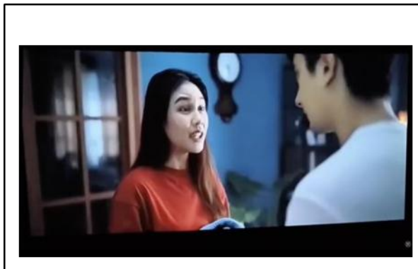
Gambar 3. Suasana ruang tamu