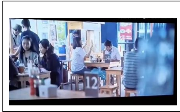
Gambar 1. . Suasana didalam kantin