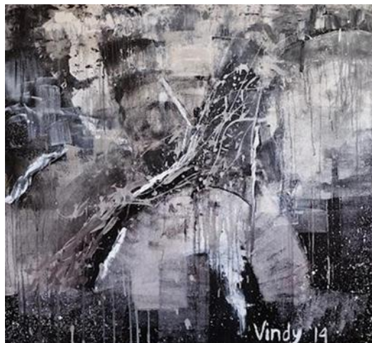
Gambar 1. Lukisan " Fear in Hesitation " (2014) karya Vindy Ariella

Hasil analisis data visual lukisan Fear in Hesitation melalui kompilasi struktural dan interpretasi perseptual, didukung oleh landasan teori Semiotika Saussure dan Psikologi Gestalt yang telah diuraikan dalam Tinjauan Pustaka. Pembahasan ini bertujuan menemukan serangkaian temuan yang berkontribusi pemahaman terhadap komunikasi visual kerentanan emosional bipolar.