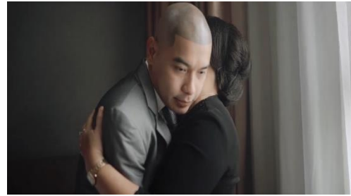
Gambar 1. kehangatan, dukungan, dan kesatuan keluarga

Gambar di atas menjelaskan ekspresi fisik dari restu, dukungan, cinta, dan kasih sayang mereka terhadap anak yang memulai babak baru dalam hidup mereka bersama pasangan hidupnya. Pelukan juga bisa mencerminkan harapan orang tua untuk kebahagiaan dan kesuksesan anak dalam pernikahan, sambil merayakan momen pemisahan dan peralihan peran. Dalam pelukan ini, terdapat nuansa keamanan dan kenyamanan, serta rasa harap bahwa pasangan baru akan menemukan kebahagiaan dan keberhasilan bersama. Dalam berbagai konteks budaya, pelukan dapat diisi dengan simbolisme khusus yang mencerminkan tradisi dan nilai-nilai yang dianut oleh keluarga. Dengan ini, pelukan orang tua pada acara pernikahan menjadi