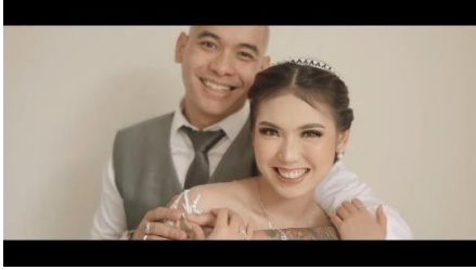
Gambar 6. Symbol awal perjalanan