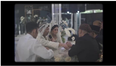
Gambar 2. Komitmen, kesetiaan dan perjanjian Bersama.

Akad pernikahan memiliki makna yang mendalam dan luas, mencakup komitmen dan kesetiaan pasangan untuk hidup bersama, hak dan kewajiban hukum yang mengatur kehidupan mereka, serta kebersamaan dan solidaritas dalam membentuk keluarga baru.