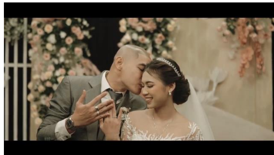
Gambar 3. Symbol hak milik dan kesetiaan

Penyematan cincin dalam upacara pernikahan merangkum makna simbolis yang mendalam. Cincin, sebagai lingkaran tanpa akhir, melambangkan kesetiaan yang tak terputus dan janji abadi untuk tetap bersama