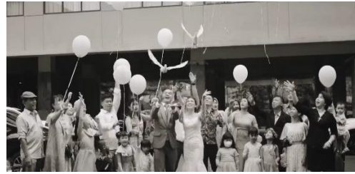
Gambar 4. Symbol pergantian status

Pelepasan merpati dalam upacara pernikahan memuat makna simbolis yang kaya. Merpati, sebagai simbol kedamaian dan kebebasan, mewakili harapan akan hidup yang damai dan bebas konflik bagi pasangan yang baru menapaki perjalanan pernikahan.