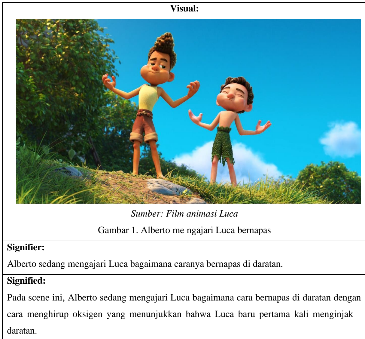
Tabel 1. Scene 00.14.15

Mengajari hal-hal baru dapat dikatakan itulah gunanya memiliki sahabat. Jika kita memiliki hal baru maka kita dapat ajarkan pada sahabat kita agar dia mengetahui apa yang mereka belum ketahui/baru bagi mereka. Tidak jauh dari scene ini, penulis menemukan prinsip animasi Squash and Stretch pada film animasi Luca.